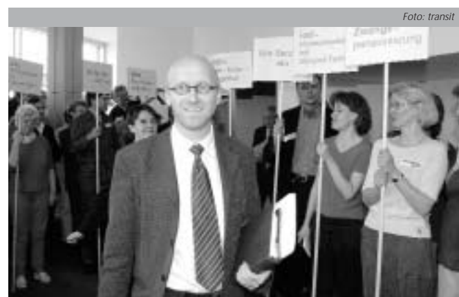
Forderungen auch zum Verhandlungsbeginn am 9. Mai.

Nun soll erst weiter verhandelt werden, wenn der neue Verwal-